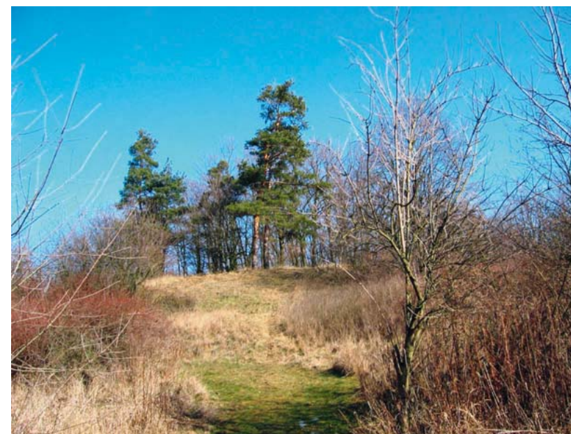
Obr. 1. k článku na straně 36 – Dřetovická Homolka, pohled od západu, stav v únoru 2017.