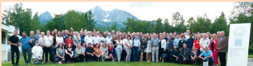
Společné foto účastníků Otevřeného geologického kongresu 2017