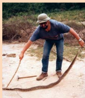
Vlevo obr. ke článku Úspěch druhé terénní akce České geologické společnosti na str. 8, pramen Břetislav – vpravo obr. ke článku Těžký život geologa ve vietnamské džungli na str. 28