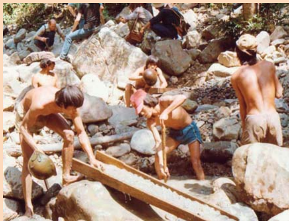
Obr. k článku Těžký život geologa ve vietnamské džungli na str. 28 – Divoká těžba zlata na lokalitě Da Ban ve Vietnamu