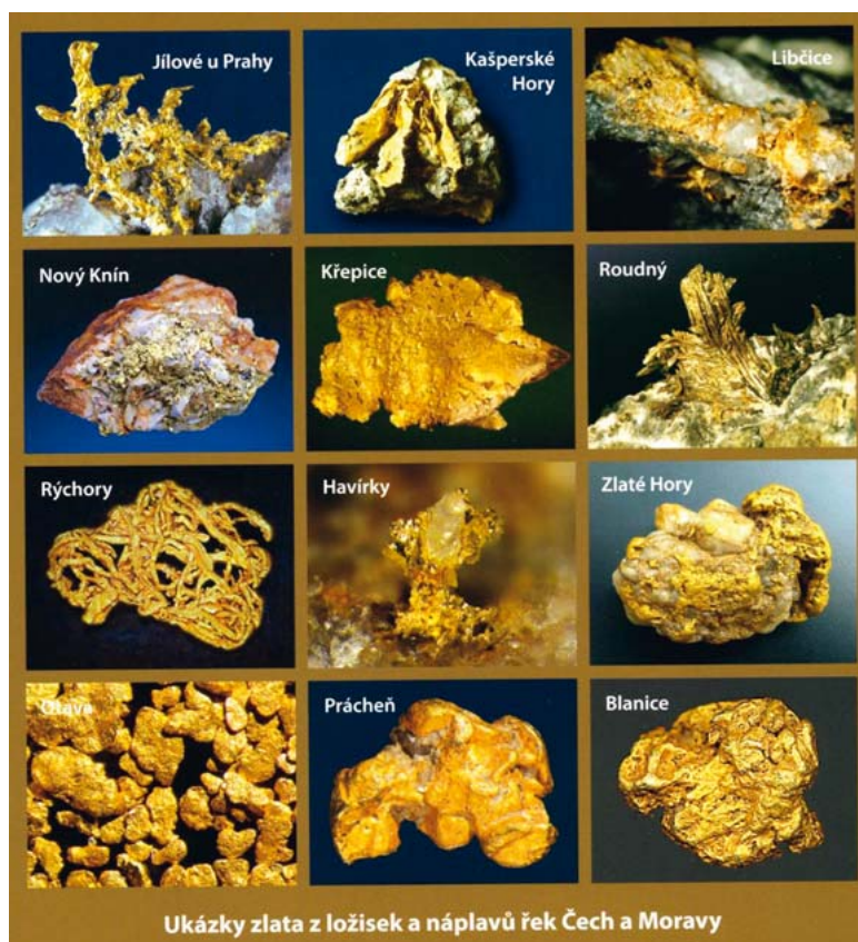
Foto k článku „Stezkami zlatonosných revírů Čech a Moravy“ na str. 22

Obrázek na 1. straně obálky: Profesor Radim Kettner