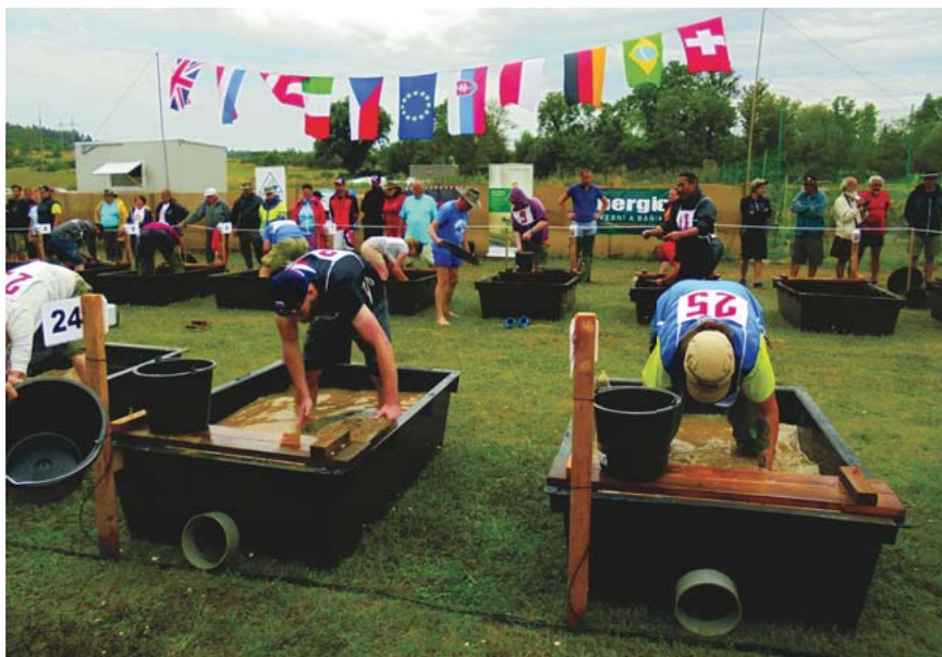
Obr. k článku „Mistrovství České a Slovenské republiky v rýžování zlata, Nový Knín 19.–21. 7. 2019“, na str. 50.