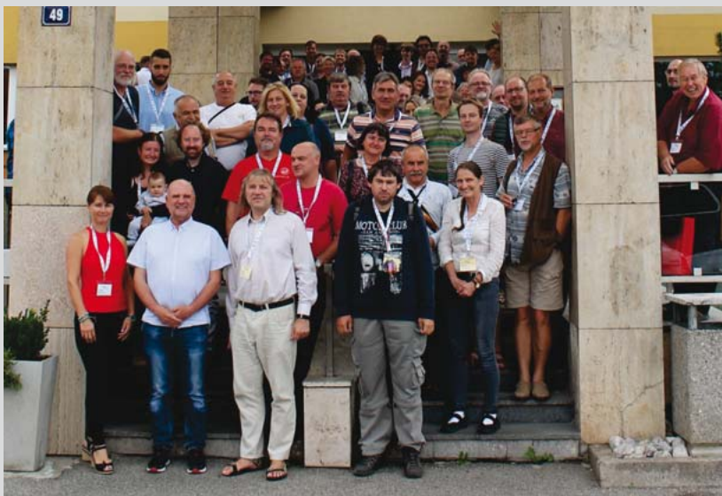
Obr. k článku „Ohlédnutí za Otevřeným geologickým kongresem 2019 v Berouně“ na str. 1, nahoře účastníci kongresu před hotelem Grand v Berouně, dole účastníci předkonferenční paleontologické exkurze na lokalitě v blízkosti Litohlavské vodní nádrže (stratotyp litohlavského souvrství, silur Pražské pánve, odkryv černých graptolitových břidlic).