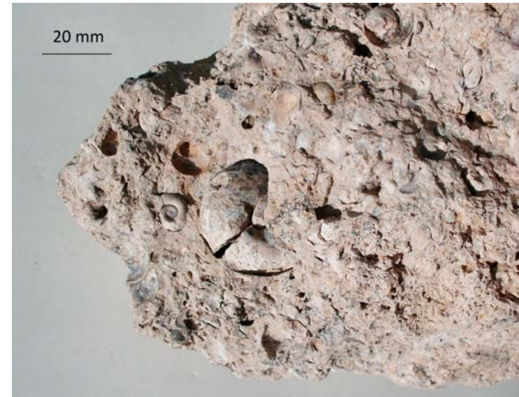
Jadrá gastropód v sladkovodnom vápenci, Pohranice, Žitavská pahorkatina, foto Alexander Fehér.

Obrázky k článku Zaujímavý nález sladkovodných vápencov v Pohraničiach na Žitavskej pahorkatine na str. 47: