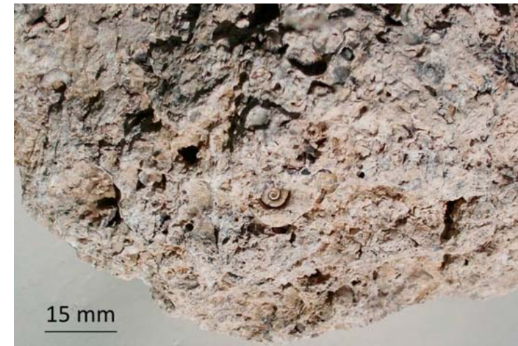
Detailný záber na jadrá gastropód v sladkovodnom vápenci, Pohranice, Žitavská pahorkatina, foto Alexander Fehér.