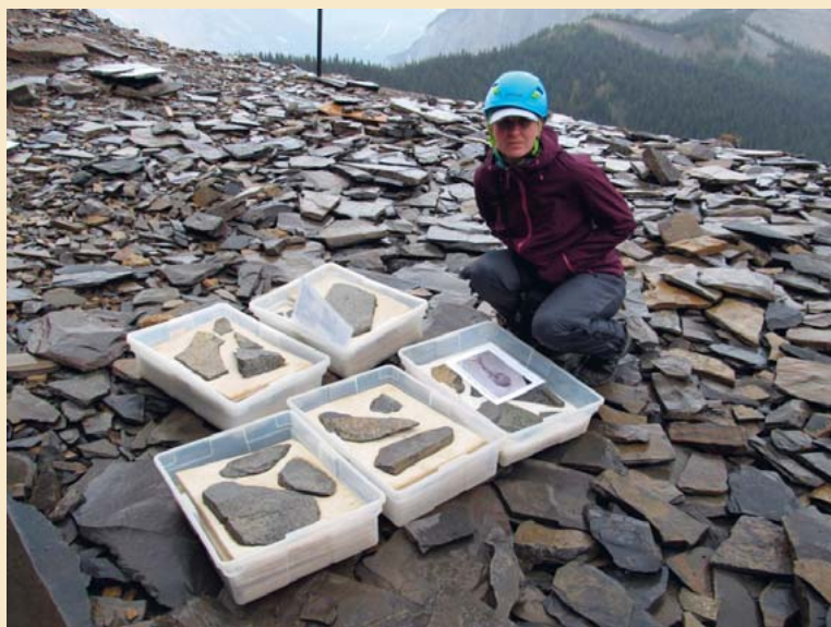
Walcottův lom USA, z přednášky Mgr. M. Tyče.

Obrázky k článku „Mineralogický klub pracuje i v době koronaviru“ na str. 4: